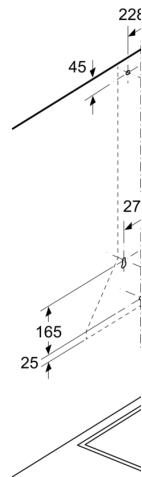
Dimensioni in mm

In caso di utilizzo di un bisogna tenere in con- dell'apparecchio.