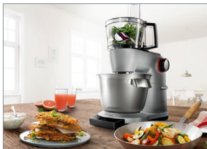
MUZ9VLP1 VeggieLove Plus