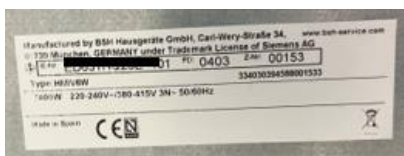
Exemplo da chapa de características de uma placa

4.2.2. Cópia integral e legível da fatura de compra emitida durante o período compreendido entre os dias 15 de fevereiro de 2026 e 15 de abril de 2026, comprovativa da compra dos produtos em campanha, sendo a entidade vendedora uma loja que cumpra o critério indicado no número 3 do presente Regulamento. Na fatura de compra deverão constar de forma clara e legível: identificação da loja, data de compra, identificação dos produtos, respetivos modelos, número da fatura de compra, nome do adquirente (que terá de coincidir obrigatoriamente com o nome do participante nesta campanha) e número fiscal do adquirente (por favor, risque ou oculte o preço dos produtos).