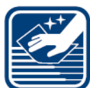
Údržba vonkajších povrchov