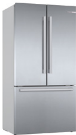
Σειρά 6 KFF96PIEP Brushed steel anti-fingerprint