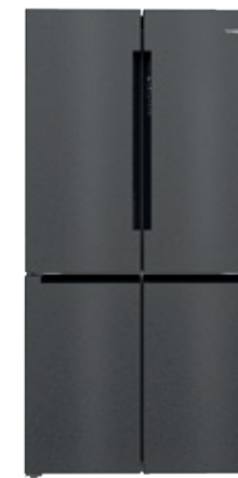
Σειρά 6 KFN96AXEA Brushed black steel anti-fingerprint