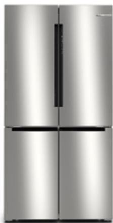
Σειρά 4 KFN96VPEA Brushed steel anti-fingerprint