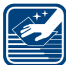
Údržba vnějších povrchů