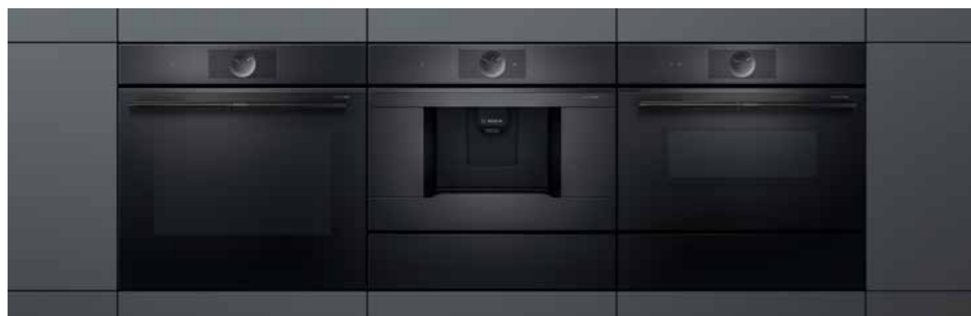
60 cm magas sütő, beépített automata kávéfőzővel, 45 cm magas kompakt sütővel és 14 cm magas melegentartó illetve vákuumfiókkal kombinálva