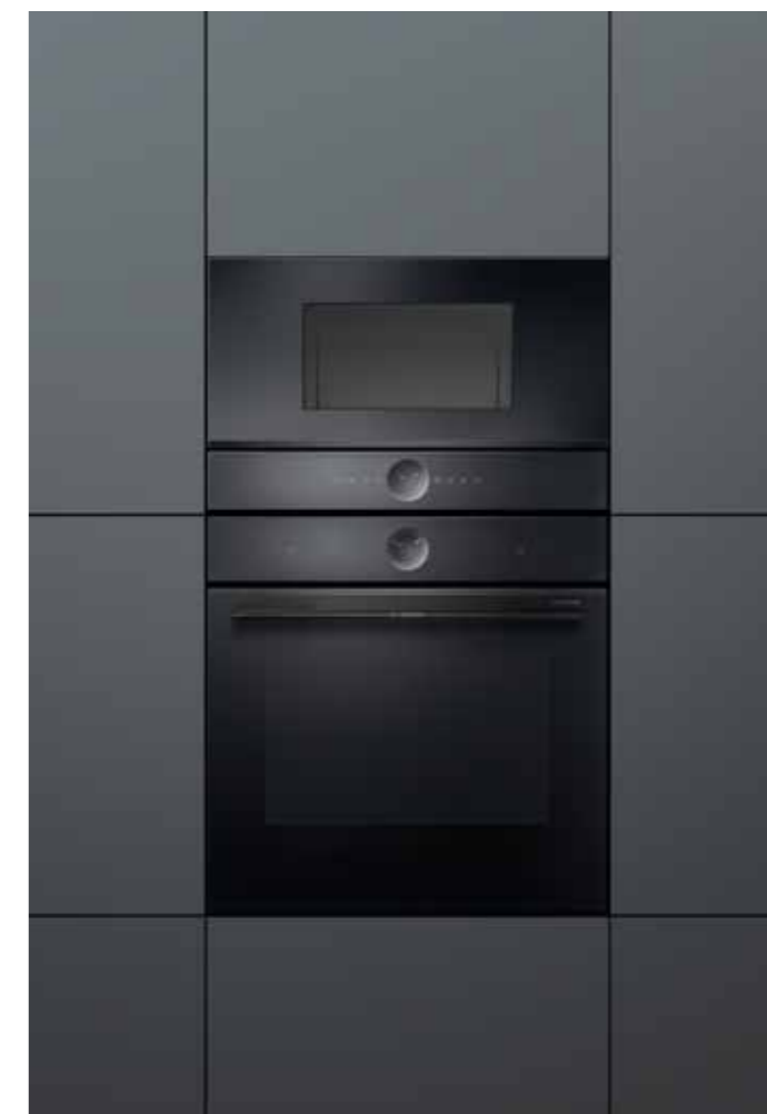
60 cm magas sütő 38 cm magas mikrohullámú sütővel kombinálva