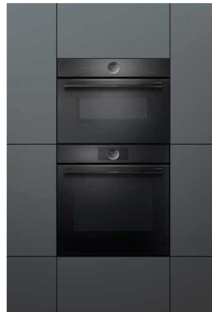
60 cm magas sütő 45 cm magas kompakt készülékkel kombinálva