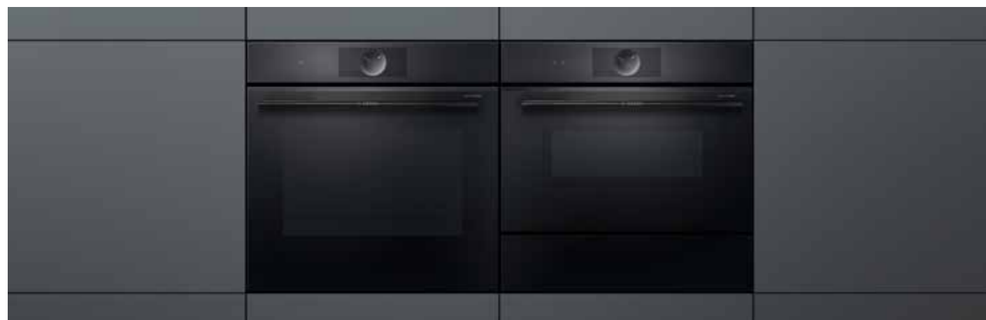
60 cm magas sütő, 45 cm magas kompakt készülékkel és 14 cm magas melegen tartó fiókkal kombinálva

Az üvegfelületek különleges mélyfekete színben jelennek meg, az ízléses, fekete, rozsdamentes acél fogantyú pedig elegánsan illeszkedik a harmonikus összképbe. Az accent line tökéletes látványt nyújt minden termékkombinációban.