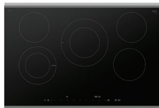
NETP069SUC Noir avec cadre en acier inoxydable

La table de cuisson électrique de la Série Benchmark MD a un design élégant et est dotée de la technologie AutoChef MD qui maintient des températures de cuisson précises.