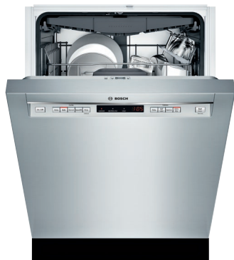
SHEM63W55N Acier inoxydable