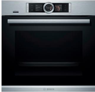
HBE5452UC Acier inoxydable

Le four mural Bosch de 24 po compatible Wi-Fi est doté de la Convection Pro et est conçu pour les petites cuisines.