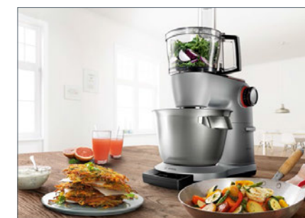
MUZ9VLP1 VeggieLove Plus