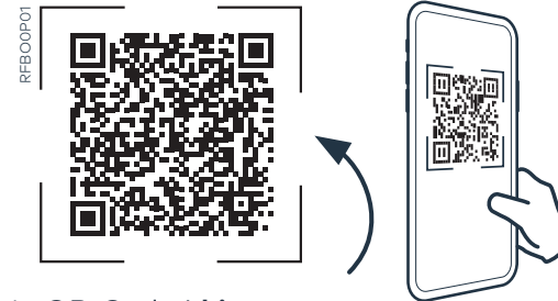
Dein QR-Code | hier scannen

2 Scanne hier mit der Home Connect App, um dich zu verbinden